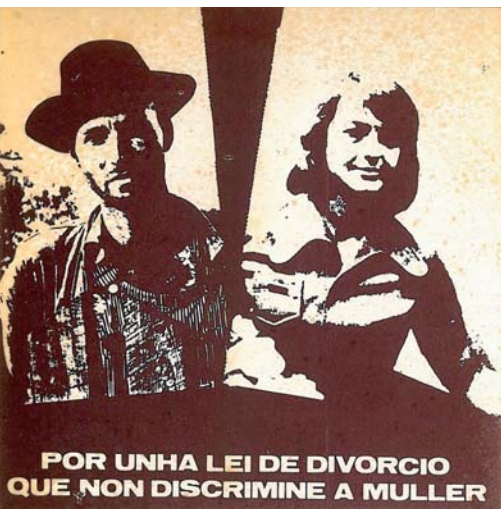
POR UNHA LEI DE DIVORCIO QUE NON DISCRIMINE A MULLER