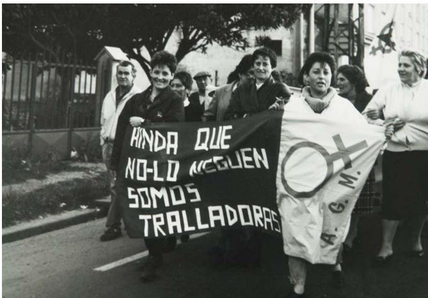
Folga de ASTANO, 1990. Narón-Ferrol

A realidade social dista moito de achegarse a unha situación equitativa entre homes e mulleres